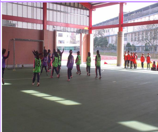
說明：三年級足球賽-進球了!